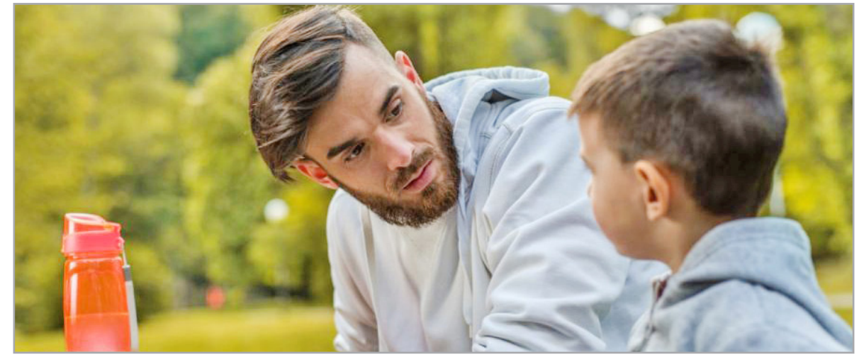
بیشتر از ۴۸ درصد مردم ایران معتقدند مردان به خاطر مهریه، تحت فشار خواسته‌های همسران خود هستند. بنابراین اگر طلاق نگیرید و مهریه مهم بود پرداخت نکنید باز هم احتمالاً ممکن است جز مردانی باشید که به خاطر مهریه توسط همسران تهدید یا تحقیر خواهید شد. وقتی ثروت بالقوه زن به واسطه مهریه از مرد بیشتر باشد، عملاً علاقه زن به مرد کم می‌شود. همچنین با مهریه زن بعد از طلاق امنیت مالی پیدا می‌کند و ممکن است باعث شود، طلاق برای زنان راحت‌تر شود.

سپس باید اقساط بدهند. ۵. من که چیزی ندارم مهم نیست چقدر مهریه باش! در سال‌های اخیر طلاق بین زوج‌هایی که بیش از ۱۰ سال سابقه ازدواج دارند بیشتر شده است، پس به سال‌های آینده خود فکر کنید که بعد از زحمت‌های بسیار ورشکست مالی نشوید. ۶. به اندازه توان مهریه قبول کن حتی اگر به اندازه توان خود مهریه کنید، اما زن از حق حبس استفاده کند یا کمتر از ۵ سال بعد طلاق بگیرید، باز هم ورشکسته محسوب